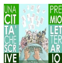
Associazione Socio-Culturale Una città che scrive