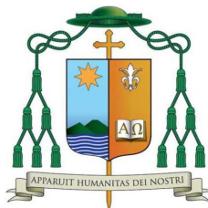
Diocesi di Acerra