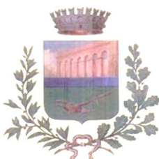
Comune di Casalnuovo di Napoli